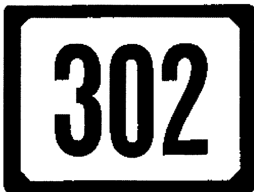
Príloha č. 4 – Vzor tabuľky orientačného čísla (mierka 1:5)