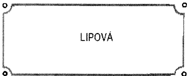
Príloha č. 2 - vzor tabuľky s vyznačením smeru ulice